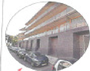
O prédio de luxo Com área total de 1544 m 2 , o edifício tem seis frações de habitação. E algumas com piscina

IMOBILIÁRIO. A AQUISIÇÃO MILIONÁRIA DO COMENTADOR