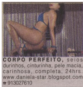
Fig. 6 Anúncio acompanhado de imagem sem rosto visível (identificável) e pose sensual