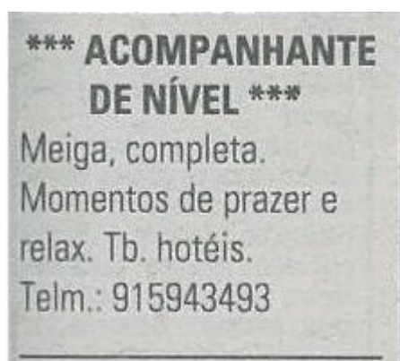
Fig. 1 Anúncio constituído apenas por texto

Em termos morfológicos, identificam-se assim três modalidades de pequeno anúncio: a) anúncio constituído apenas por um breve texto ; b) anúncio de texto com composição gráfica a conferir alguma espécie de destaque visual ; c) e anúncio acompanhado de imagem .