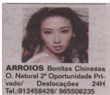
Fig. 4 Anúncio com imagem com rosto visível (identificável)