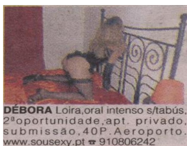
Fig. 3 Anúncio acompanhado de imagem