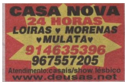
Fig. 2 Anúncio de texto com composição gráfica