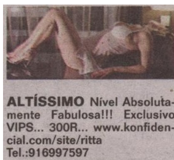
Fig. 7 Anúncio acompanhado de imagem e referência a site de internet