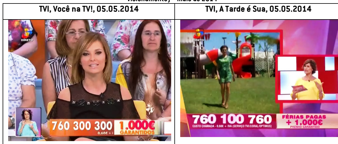
«Figura 6- Promoções gráficas dos concursos publicitários nos programas da manhã e da tarde da (...) TVI (1.º visionamento) – maio de 2014

10. As imagens representativas do acima exposto reproduzem-se em seguida (Deliberação 99/2015 (OUT-TV), pág. 21):