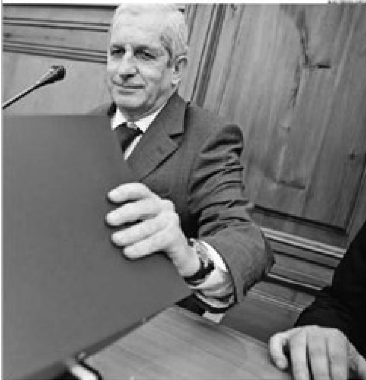
Carlos Tavares foi ouvido na comissão parlamentar de inquérito ao BES em Novembro de 2014

Público e Comunicação Social, S.A. 18 de Julho de 2020 • 3