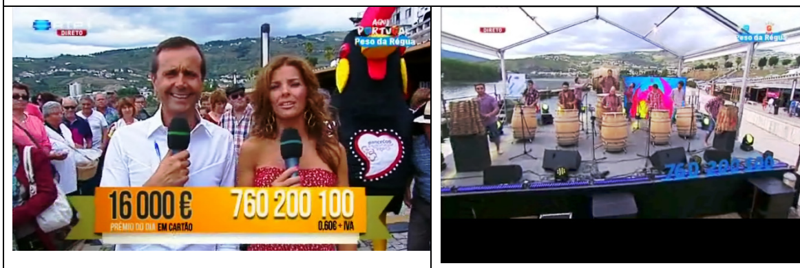
RTP, Aqui Portugal, 20.09.2014