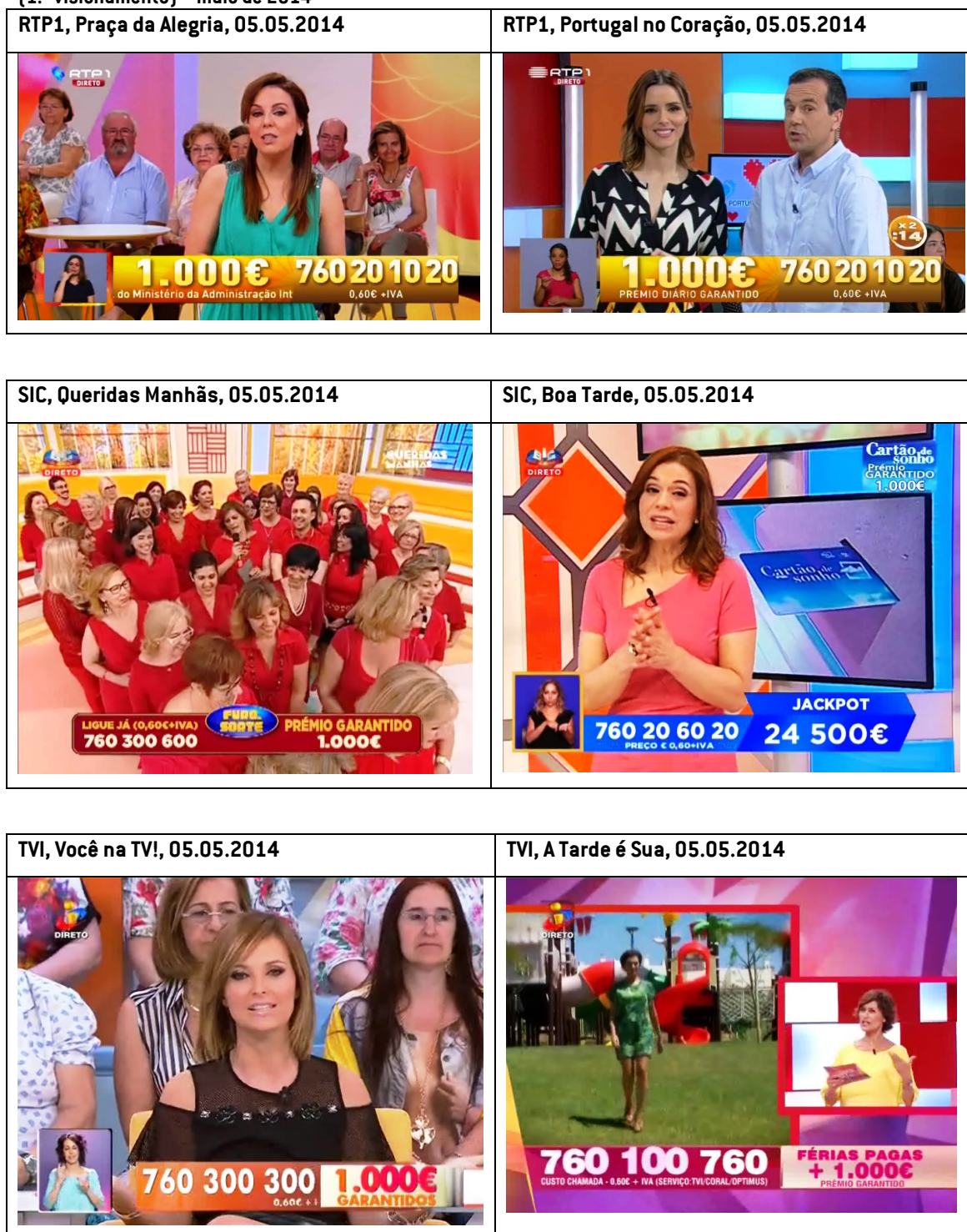
Fig. 6 Promoções gráficas dos concursos publicitários nos programas da manhã e da tarde da RTP1, SIC e TVI (1.º visionamento) – maio de 2014

dos programas da SIC; uma das tarjetas plasma um apelo direto aos espectadores para telefonarem, através da mensagem «Ligue Já!».